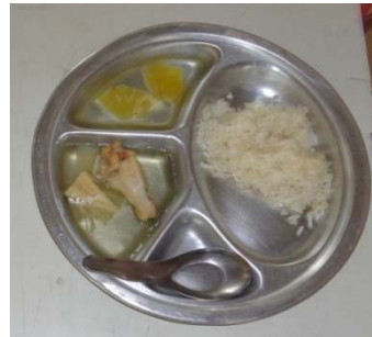
อาหารกลางวันของเด็กนักเรียน

โรงเรียนวัดคงคาหวดีมีการส่งเสริมกิจกรรมด้านการเกษตร โดยให้เด็กนักเรียนทำแปลงปลูกผักและเพาะเห็ด ดังรูป