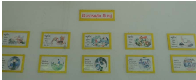
รูปโปสเตอร์ภายในศูนย์พัฒนาเด็กเล็กบ้านปากบางภูมี

ศูนย์พัฒนาเด็กเล็กบ้านปากบางภูมี และศูนย์พัฒนาเด็กเล็กวัดควนเนียง มีการให้ความรู้เรื่องผักผลไม้ และอาหารหลัก 5 หมู่ โดยการติดรูปโปสเตอร์ไว้ที่โรงอาหาร ดังรูป