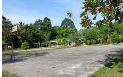
สนามบาสเกตบอล

5.3 โรงเรียนบ้านควนเนียงใน มีกิจกรรมการออกกำลังกายที่ให้นักเรียนทำพร้อมกันทั้งโรงเรียนคือ กายบริหาร โรงเรียนมีชั่วโมงพลศึกษาในหลักสูตร 1 คาบต่อสัปดาห์ สถานที่ออกกำลังกายที่กว้างที่สุดประมาณ 15 x 26 เมตร มีสนามฟุตบอล 1 แห่ง สนามแบดมินตัน 1 แห่ง สนามตะกร้อ 1 แห่ง สนามบาสเกตบอล 1 แห่ง และสนามวอลเลย์บอล 1 แห่ง