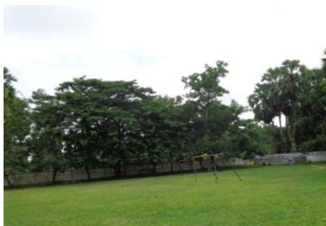
สนามฟุตบอล

5.2 โรงเรียนวัดโพธิ์กลางมีชั่วโมงพลศึกษาในหลักสูตร 1 คาบต่อสัปดาห์ สถานที่ออกกำลังกายที่กว้างที่สุดประมาณ 50 x 100 เมตร มีสนามฟุตบอล 1 แห่ง สนามแบดมินตัน 1 แห่ง สนามตะกร้อ 1 แห่ง และสนามวอลเลย์บอล 1 แห่ง