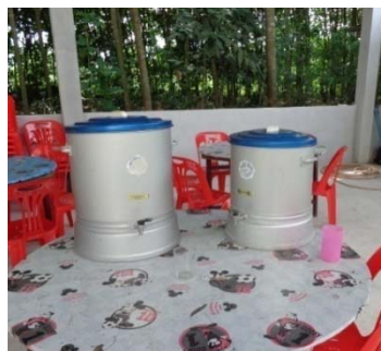
โรงเรียนชุมชนบ้านโคกค้าย

โรงเรียนชุมชนบ้านโคกค้าย โรงเรียนวัดไทรใหญ่ และโรงเรียนบ้านไสท่อนมีนมให้เด็กดื่มฟรีเป็นนมจืดทุกวัน และมีบริการน้ำดื่มให้เด็กดื่ม ดังรูป