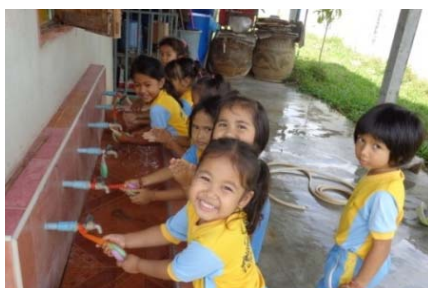
เด็กๆล้างมือก่อนรับประทานอาหาร