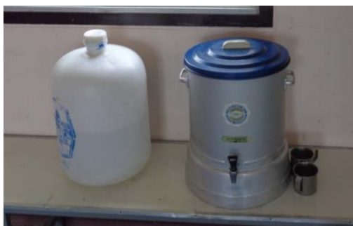
น้ำดื่มสำหรับเด็กดื่ม