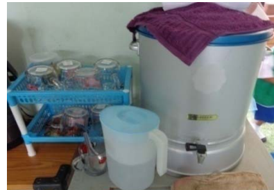
ศพด.บ้านโคกค้าย