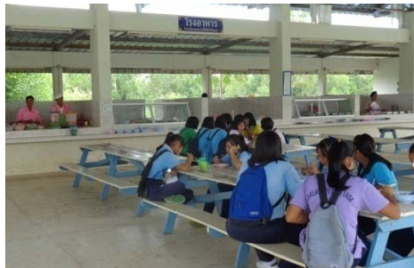
โรงอาหารโรงเรียนชะแล่นิมิตวิทยา

โรงเรียนชะแล่นิมิตวิทยามีร้านขายอาหารที่มีผักเป็นส่วนประกอบหลัก เช่น แกงจืด ผัดผัก แกงเลียง แกงส้ม ข้าวยา ขนมหจีน น้อยกว่าครึ่งหนึ่งของจำนวนร้านทั้งหมด แต่ไม่มีร้านขายอาหารที่มีไขมันสูง เช่น ข้าวมันไก่ ข้าวขาหมู ข้าวหมูแดง ก๋วยเตี๋ยวผัด หรือข้าวผัด