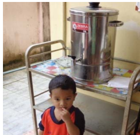
ศพด.บ้านลูกรัก

ศูนย์พัฒนาเด็กเล็กบ้านลูกรัก ศูนย์พัฒนาเด็กเล็กบ้านโคกค้าย และศูนย์พัฒนาเด็กเล็กวัดไทรใหญ่มีนมให้เด็กดื่มฟรีเป็นนมจืดทุกวัน และมีน้ำดื่มบริการให้เด็กดื่ม ทางศูนย์ไม่อนุญาตให้เด็กนำขนมมาที่ศูนย์ แต่อนุญาตให้เด็กนำขบวนมาได้เฉพาะช่วงที่เด็กมาศูนย์ใหม่ๆ