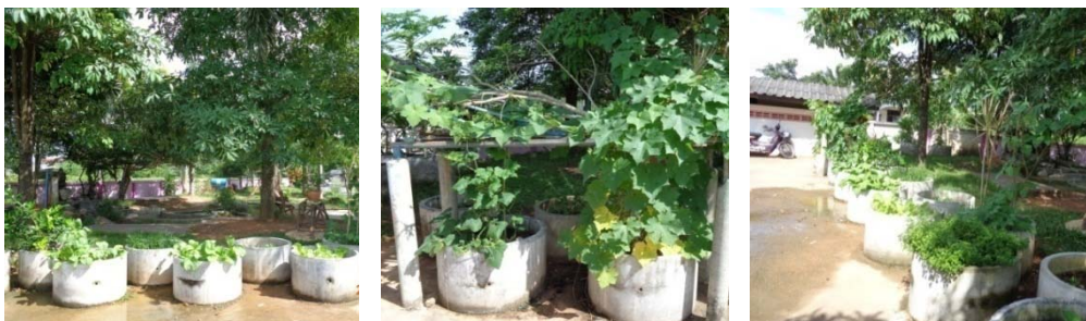
แปลงปลูกผักของศูนย์พัฒนาเด็กเล็กบ้านโคกค่าย

ศูนย์พัฒนาเด็กเล็กบ้านโคกค่าย ครูและเด็กร่วมกันปลูกผักไว้รอบๆ ศูนย์ ดังรูป