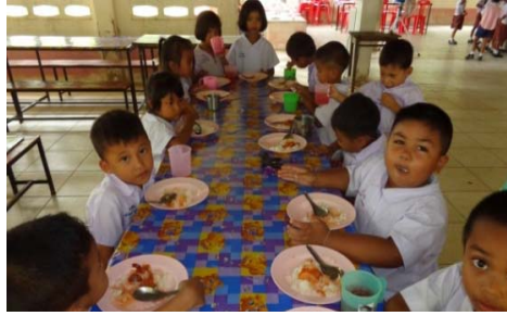
การรับประทานอาหารกลางวัน

โรงเรียนวัดไทรใหญ่มีการส่งเสริมกิจกรรมด้านการเกษตร โดยให้เด็กนักเรียนทำแปลงปลูกผัก ดังรูป