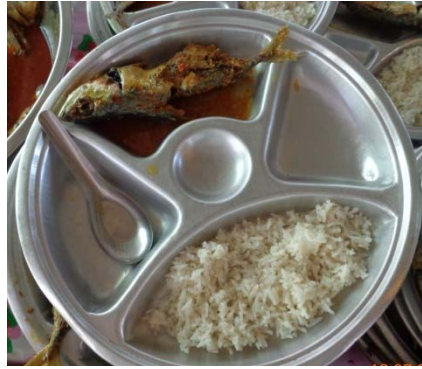
อาหารกลางวันของเด็กนักเรียน

3.4 รายการอาหารกลางวันของโรงเรียนบ้านหนองปลิงโรงเรียนจัดทำเองทั้งหมด โดยมีรายการอาหารที่วางแผนล่วงหน้าเป็นรายสัปดาห์ จากรายการอาหารใน 1 สัปดาห์ที่ผ่านมา อาหารหลักมีทั้งข้าวสวย และอาหารจานเดียว เมนูอาหารไม่มีเลือดและตับเป็นส่วนประกอบ มีไข่ 1 วัน มีผักทุกวัน มีผลไม้ 2 วัน และใน 1 สัปดาห์ไม่มีเมนูซ้ำ (ตารางที่ 6)