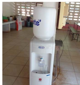
โรงเรียนวัดไทรใหญ่