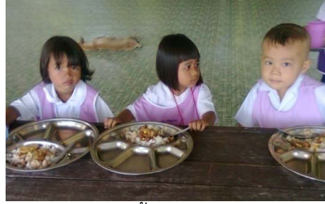
การรับประทานอาหารกลางวันของเด็กระดับชั้นอนุบาล

โรงเรียนวัดโพธิ์กลางมีการส่งเสริมกิจกรรมการเรียนรู้ด้านการเกษตรให้กับเด็กนักเรียน โดยมีศูนย์การเรียนรู้การเพาะเห็ดนางฟ้าและการเพาะเลี้ยงปลาตู้ภายในโรงเรียน ดังรูป