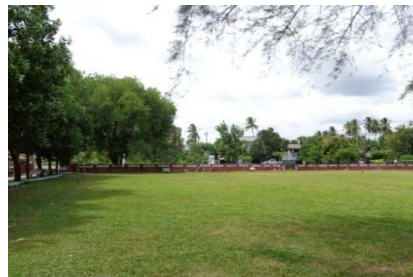
สนามฟุตบอล

5.1 โรงเรียนวัดคงคาหวดีมีกิจกรรมการออกกำลังกายที่ทางโรงเรียนจัดให้นักเรียนทำพร้อมกันทั้งโรงเรียนคือ กายบริหาร โรงเรียนมีชั่วโมงพลศึกษาในหลักสูตร 1 คาบต่อสัปดาห์ สถานที่ออกกำลังกายที่กว้างที่สุดประมาณ 60 x 100 เมตร มีสนามฟุตบอล 1 แห่ง โต๊ะปิงปอง 1 แห่ง สนามตะกร้อ 1 แห่ง สนามวอลเลย์บอล 1 แห่ง และสนามเปตอง 1 แห่ง