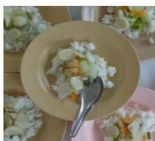
อาหารกลางวันของเด็ก