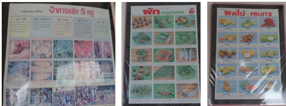
รูปโปสเตอร์ภายในศูนย์พัฒนาเด็กเล็กวัดควนเนียง