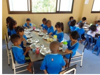
การรับประทานอาหารกลางวัน