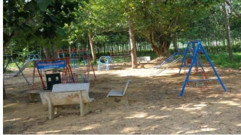
สนามเด็กเล่นของนักเรียนระดับชั้นอนุบาลมีพื้นสนามเป็นพื้นดิน

5.2 โรงเรียนวัดไทรใหญ่มีกิจกรรมการออกกำลังกายที่ให้นักเรียนทำพร้อมกันทั้งโรงเรียน คือ การเต้นแอโรบิก และให้นักเรียนร่วมกันพัฒนาโรงเรียนในช่วงเช้าของทุกวัน โรงเรียนมีชั่วโมงพลศึกษาในหลักสูตร 1 คาบต่อสัปดาห์ สถานที่ออกกำลังกายที่กว้างที่สุดประมาณ 70 x 100 เมตร มีสนามฟุตบอล 1 แห่ง สนามตะกร้อ 2 แห่ง และสนามวอลเลย์บอล 1 แห่ง