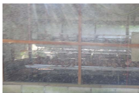
การเลี้ยงไก่

3.2 รายการอาหารกลางวันของโรงเรียนวัดไทรใหญ่ โรงเรียนจัดทำเองทั้งหมดโดยมีรายการอาหารที่วางแผนล่วงหน้าเป็นรายวัน จากรายการอาหารใน 1 สัปดาห์ที่ผ่านมา อาหารหลักมีทั้งข้าวสวย และอาหารจานเดียว เมนูอาหารไม่มีเลือดและตับเป็นส่วนประกอบ มีไข่ 1 วันใน 1 สัปดาห์ มีผัก 4 วัน มีผลไม้และขนมหวานไทยหรือเบเกอรี่ที่ทางโรงเรียนขายให้นักเรียนเลือกซื้อรับประทาน และใน 1 สัปดาห์ไม่มีเมนูซ้ำ (ตารางที่ 5)