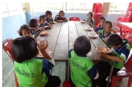
การรับประทานอาหารกลางวัน