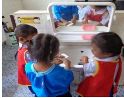
เด็กๆ ล้างมือก่อนรับประทานอาหาร