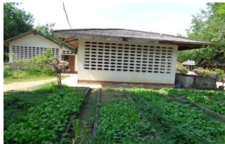
แปลงปลูกผักของเด็กนักเรียน

โรงเรียนวัดไทรใหญ่มีการส่งเสริมกิจกรรมด้านการเกษตร โดยให้เด็กนักเรียนทำแปลงปลูกผัก ดังรูป