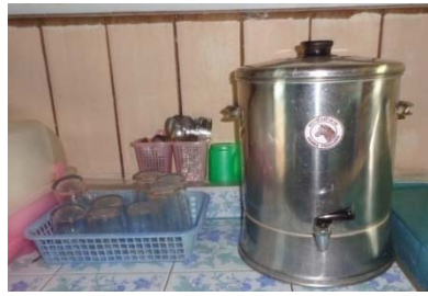
โรงเรียนบ้านยางงาม