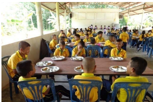
การรับประทานอาหารกลางวัน