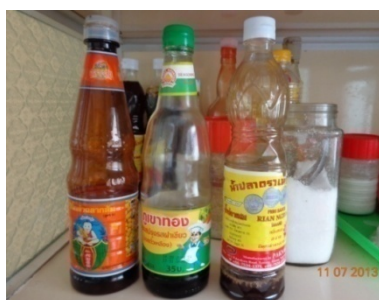
เครื่องปรุงรสอาหาร