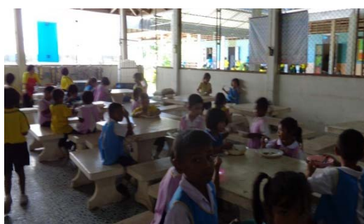
การรับประทานอาหารกลางวันของเด็กระดับชั้นอนุบาล

โรงเรียนวัดชะแล้มีการส่งเสริมกิจกรรมด้านการเกษตร โดยให้เด็กนักเรียนทำแปลงปลูกผักเพื่อนำมาใช้ประกอบอาหารกลางวัน ดังรูป