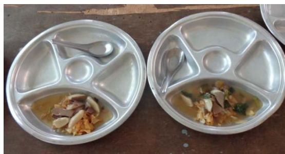
อาหารกลางวันของเด็ก