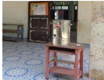
โรงเรียนบ้านหนองปลิง