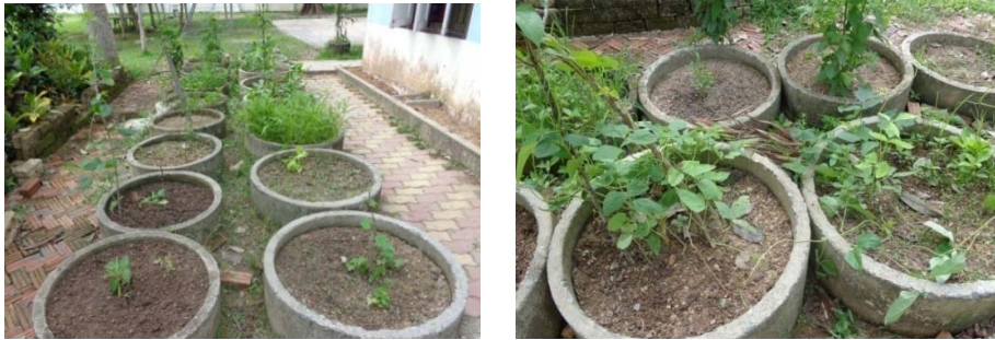
แปลงปลูกผักของเด็กนักเรียน

โรงเรียนบ้านไสท่อนมีการส่งเสริมกิจกรรมด้านการเกษตร โดยให้เด็กนักเรียนปลูกผักไว้รอบๆ อาคาร และบริเวณหน้าโรงเรียน ดังรูป