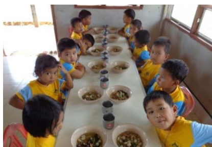
การรับประทานอาหารกลางวัน

3.3 รายการอาหารกลางวันของศูนย์พัฒนาเด็กเล็กวัดควนเนียง ศูนย์พัฒนาเด็กเล็กจัดทำเองทั้งหมด โดยครูเป็นผู้กำหนดรายการอาหารล่วงหน้าเป็นรายเดือน จากรายการอาหารใน 1 สัปดาห์ที่ผ่านมา อาหารหลักมีทั้งข้าวสวย และอาหารจานเดียว รายการอาหารใน 1 สัปดาห์ไม่มีเลือดและไข่เป็นส่วนประกอบ มีตับ 2 วัน ขนมหวานไทย 2 วัน มีผักและผลไม้ 3 วัน และใน 1 สัปดาห์ไม่มีเมนูซ้ำ (ตารางที่ 4)