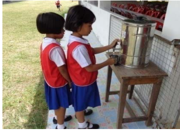
โรงเรียนวัดคงคาหวดี