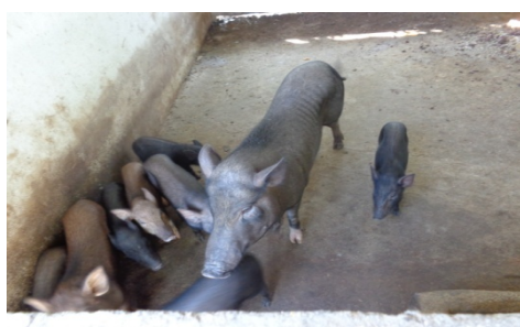
การเลี้ยงหมู

โรงเรียนชุมชนบ้านโคกค้ายมีโครงการเกษตรเพื่ออาหารกลางวัน โดยโรงเรียนมีการฝึกทักษะให้เด็ก ได้ปลูกผักตามฤดูกาล การเลี้ยงหมูและไก่ และการปลูกผลไม้ในท้องถิ่น เช่น มะนาว มะละกอ เป็นต้น และเอาผลผลิตเข้าสู่อาหารกลางวันของเด็กนักเรียน ดังรูป