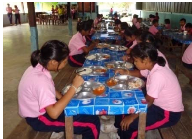
การรับประทานอาหารกลางวัน