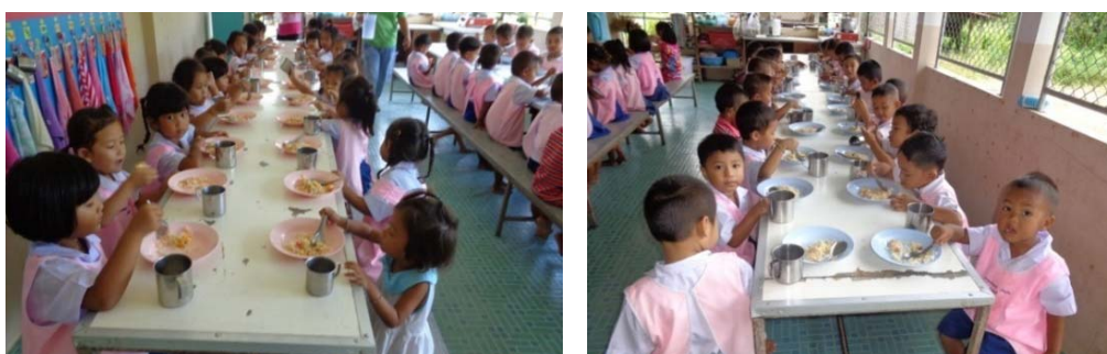
การรับประทานอาหารกลางวัน

3.2 รายการอาหารกลางวันของศูนย์พัฒนาเด็กเล็กบ้านควนเนียงใน อบต.เป็นผู้จ้างเหมาให้บุคคลภายนอกจัดทำให้ โดยครูเป็นผู้กำหนดรายการอาหารล่วงหน้าเป็นรายเดือน จากรายการอาหารใน 1 สัปดาห์ที่ผ่านมา อาหารหลักมีทั้งข้าวสวย และอาหารประเภทเส้น เมนูอาหารใน 1 สัปดาห์ไม่มีเลือดและไข่เป็นส่วนประกอบ มีตับ 1 วัน มีผัก 4 วัน มีผลไม้ทุกวัน และใน 1 สัปดาห์ไม่มีเมนูซ้ำ (ตารางที่ 3)