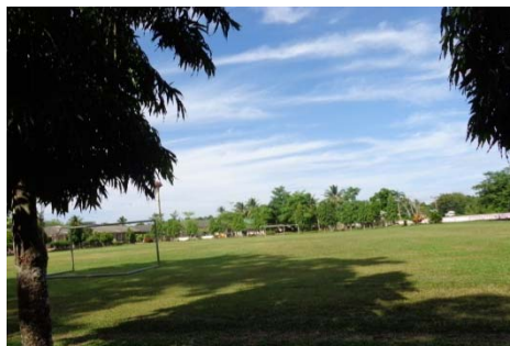
สนามฟุตบอล

5.1 โรงเรียนชุมชนบ้านโคกค้ายมีชั่วโมงพลศึกษาในหลักสูตร 1 คาบต่อสัปดาห์ สถานที่ออกกำลังกายที่กว้างที่สุดประมาณ 70 x 100 เมตร มีสนามฟุตบอล 1 แห่ง สนามแบดมินตัน 1 แห่ง สนามตะกร้อ 1 แห่ง และสนามวอลเลย์บอล 1 แห่ง