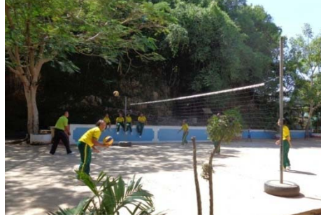
สนามวอลเลย์บอล

6.2 โรงเรียนชะแล่นิมิตวิทยามีกิจกรรมการออกกำลังกายที่ทางโรงเรียนจัดให้นักเรียนทำพร้อมกันทั้งโรงเรียนคือ เต้นแอโรบิก และลีลาศ โรงเรียนมีชั่วโมงพลศึกษาในหลักสูตรมัธยมศึกษาตอนต้นและตอนปลาย 2 คาบต่อสัปดาห์ สถานที่ออกกำลังกายที่กว้างที่สุดประมาณ 70 x 100 เมตร มีสนามฟุตบอล 2 แห่ง โต๊ะปิงปอง 1 แห่ง สนามตะกร้อ 1 แห่ง สนามบาสเกตบอล 1 แห่ง และสนามวอลเลย์บอล 1 แห่ง