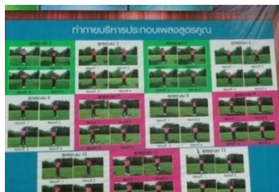
ทำกายบริหารประกอบเพลงสูตรคูณ

5.2 โรงเรียนบ้านยางงามมีกิจกรรมการออกกำลังกายที่ทางโรงเรียนจัดให้นักเรียนทำพร้อมกันทั้งโรงเรียนคือ กายบริหารประกอบเพลงสูตรคูณ โรงเรียนมีชั่วโมงพลศึกษาในหลักสูตร 2 คาบต่อสัปดาห์ สถานที่ออกกำลังกายที่กว้างที่สุดประมาณ 50 x 100 เมตร มีสนามฟุตบอล 1 แห่ง โต๊ะปิงปอง 1 แห่ง สนามตะกร้อ 1 แห่ง และสนามวอลเลย์บอล 1 แห่ง