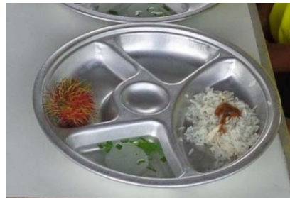
อาหารกลางวันของเด็ก