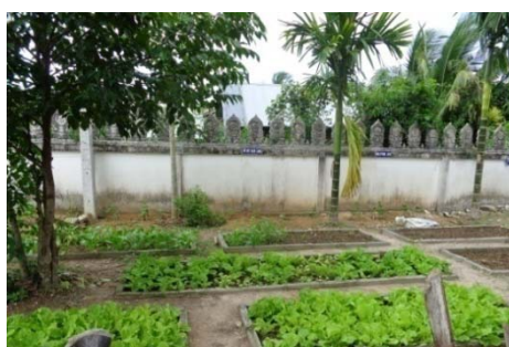
แปลงปลูกผักของเด็กนักเรียน

โรงเรียนวัดท่าหินมีการส่งเสริมกิจกรรมด้านการเกษตร โดยให้เด็กนักเรียนทำแปลงปลูกผักบริเวณโรงเรียน ดังรูป