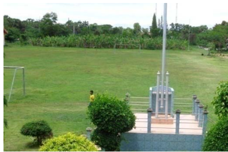
สนามฟุตบอล

5.1 โรงเรียนวัดท่าหินมีชั่วโมงพลศึกษาในหลักสูตร 1 คาบต่อสัปดาห์ สถานที่ออกกำลังกายที่กว้างที่สุดประมาณ 70 x 100 เมตร มีสนามฟุตบอล 1 แห่ง โต๊ะปิงปอง 2 แห่ง และสนามบาสเกตบอล 1 แห่ง