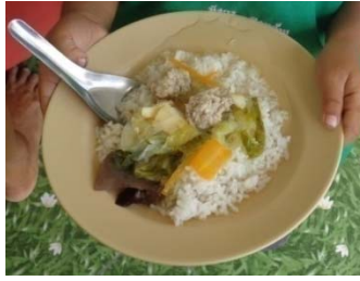
อาหารกลางวันของเด็ก