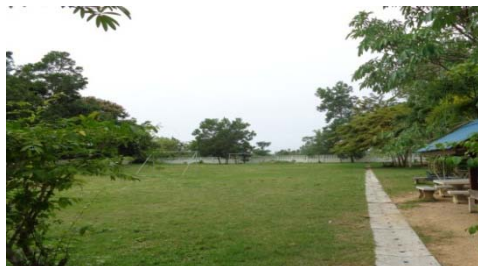
สนามฟุตบอล

5.3 โรงเรียนบ้านไสท่อน มีกิจกรรมการออกกำลังกายที่ให้นักเรียนทำพร้อมกันทั้งโรงเรียน คือ กิจกรรมที่สอนน้องเล่นวอลเลย์บอลประมาณครึ่งชั่วโมง โรงเรียนมีชั่วโมงพลศึกษาในหลักสูตร 1 คาบต่อสัปดาห์ สถานที่ออกกำลังกายที่กว้างที่สุดประมาณ 24.4 x 45.2 เมตร มีสนามฟุตบอล 1 แห่ง โต๊ะปิงปอง 1 แห่ง สนามตะกร้อ 1 แห่ง และสนามวอลเลย์บอล 1 แห่ง