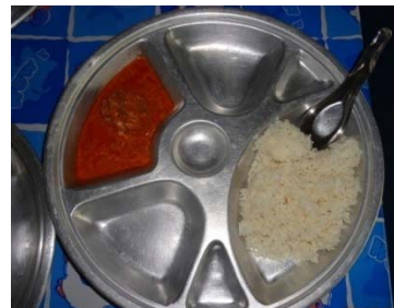
อาหารกลางวันของเด็กนักเรียน

3.3 รายการอาหารกลางวันของโรงเรียนบ้านควนเนียงใน โรงเรียนจัดทำเองทั้งหมดโดยมีรายการอาหารที่วางแผนล่วงหน้าเป็นรายสัปดาห์ จากรายการอาหารใน 1 สัปดาห์ที่ผ่านมา อาหารหลักมีทั้งข้าวสวย และอาหารจานเดียว เมนูอาหารไม่มีเลือดเป็นส่วนประกอบ มีดับ 2 วัน มีไข่ 2 วัน มีผักทุกวัน มีผลไม้ 3 วัน มีขนมหวานไทย 2 วัน และใน 1 สัปดาห์ไม่มีเมนูซ้ำ (ตารางที่ 5)