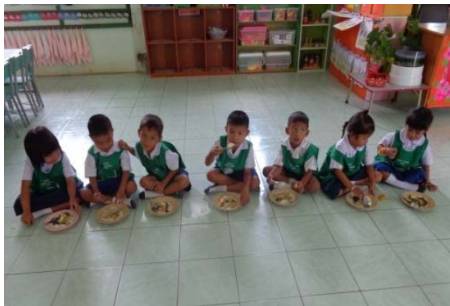
การรับประทานอาหารกลางวัน