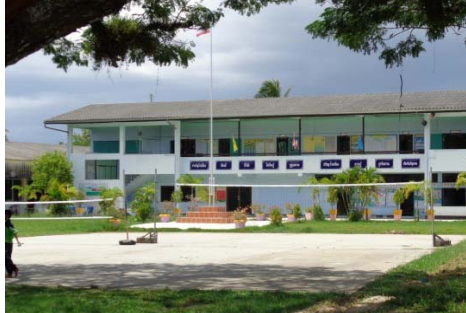
สนามตะกร้อและสนามวอลเลย์บอล

5.3 โรงเรียนวัดห้วยลาด มีกิจกรรมการออกกำลังกายที่ให้นักเรียนทำพร้อมกันทั้งโรงเรียน คือ ต้น แอโรบิก โรงเรียนมีชั่วโมงพลศึกษาในหลักสูตร 1 คาบต่อสัปดาห์ สถานที่ออกกำลังกายที่กว้างที่สุดประมาณ 64 x 85 เมตร มีสนามฟุตบอล 1 แห่ง สนามตะกร้อ 1 แห่ง สนามบาสเกตบอล 1 แห่ง สนามวอลเลย์บอล 1 แห่ง และสนามเปตอง 1 แห่ง