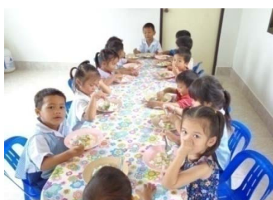
การรับประทานอาหารกลางวัน