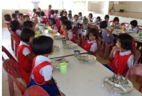
การรับประทานอาหารกลางวัน