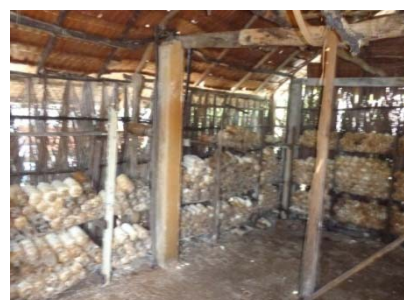
เรือนเพาะเห็ดของโรงเรียน