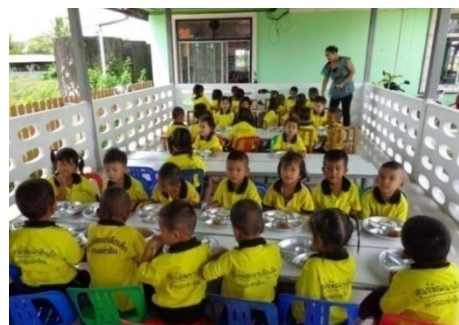
การรับประทานอาหารกลางวัน