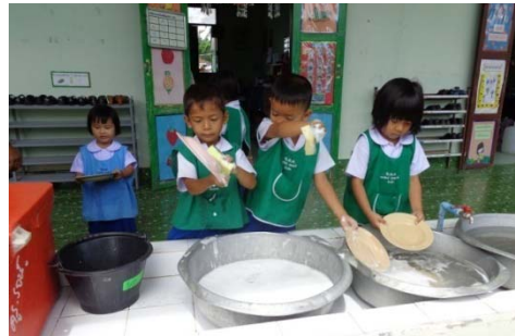
เด็กๆ ล้างจานหลังจากรับประทานอาหาร