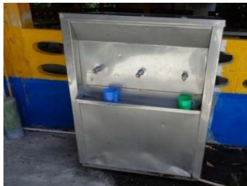
โรงเรียนบ้านควนเนียงใน