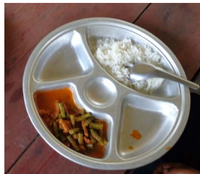
อาหารกลางวันของเด็กนักเรียน