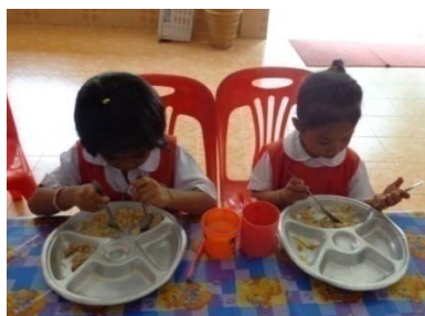
การรับประทานอาหารกลางวันของเด็กระดับชั้นอนุบาล